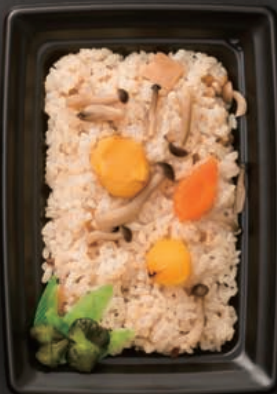
◎焼き栗としめじご飯 298円(税別)