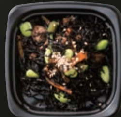
◎ひじき煮 (100g) 180円(税別)