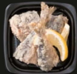
◎秋産物の酢漬 (100g) 198円～(税別)