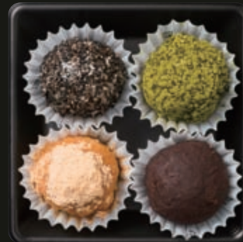
◎おはぎ(黒胡麻・抹茶・きなこ・こしあん) 110円～120円(税別)