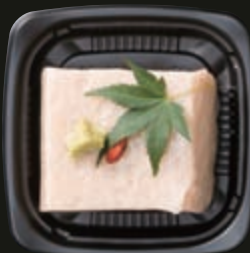
◎ビーナッツ豆腐 200円(税別)