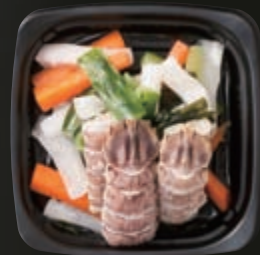
◎季節の酢物 (100g) 180円～(税別)